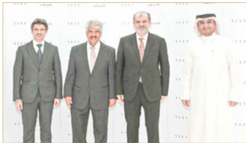
خلال تسليم تبرع "عقارات السيف"

وتستهدف مضخات الإنسولين علاج الأطفال المصابين بالسكري الذين تقل أعمارهم عن 16 سنة ممن ما يزالون في قوائم الانتظار لدى مجمع السلمانية الطبي.